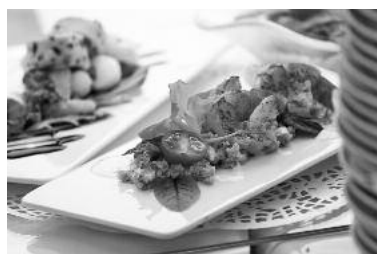
Die einzelnen Gastronomen beraten Sie gerne an ihren Ständen.

Die kreative Küchencrew der Bürgerstube bietet erstmalig bei Wein auf der Insel allerlei Leckereien für Sie an.