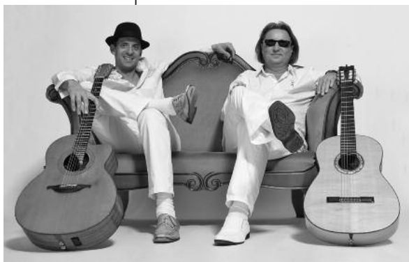
Magic acoustic Guitars sorgt am Sonntag für die musikalische Umrahmung.

Swing Trio mit einem Mix aus Swing, Dixiland und Rock- und Popoldies auf einen stimmungsvollen Abend ein.