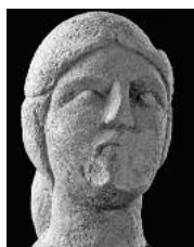
Bruchstück einer lebensgroßen römischen Grabstatue.