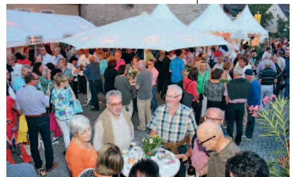
Foto: Riecker Weitere Fotos von Wein auf der Insel finden Sie demnächst auf der städtischen Homepage unter http://www.lauffen.de/website/deltourismus/essen_trinken/kulinarische_fest/wein_auf_der_ins el Fotos und Text: Ebert

Am 2. Oktober steht es fest: das „Weinfest des Jahres“ Das Weinfest, das am 2. Oktober 2014 nach der letzten Stimmenkontrolle um 14.00 Uhr die meisten Stimmen aufweist, wird von daheim in Deutschland als „Weinfest des Jahres“ gekürt und mit dem Hauptpreis von 3.000 Euro unterstützt. Der zweite Platz erhält 1.500 und der dritte Platz 500 Euro. Helfen Sie mit, dass „Wein auf der Insel“ einen guten Platz belegt. ■