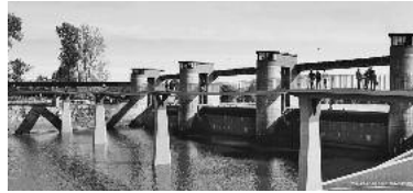
Visualisierung neue Radwegbrücke Wehr Horkheim Visualisierung Urheber: Mayr Ludescher Partner/Auer Weber

Der Gemeinderat hatte sich für die Weiterverfolgung der Trassenvariante C2 als Vorzugsvariante für die zukünftige Führung des Neckartalradwegs zwischen Lauffen a.N. und Heilbronn ausgesprochen. Diese Variante sieht eine Streckenführung am linken Neckarufer mit Querungsmöglichkeit im Unterwasser des Wehres Horkheim mittels einer Radwegbrücke vor. Die Brücke schließt auf Höhe des Hochwassersperrotes an den bestehenden Radweg nach Heilbronn an. In Richtung Lauffen erfolgt die Streckenführung weitgehend auf bereits bestehenden, asphaltierten Feldwegen sowie auf Straßen. Ein radwegtauglicher Ausbau des vorhandenen Uferbegleitwegs ist lediglich auf einer Länge von ca. 1,2 km vom Wehr Horkheim bis zum Wasen erforderlich. Aus einer Mehrfachbeauftragung zusammen mit der Stadt Heilbronn für den Neubau der Radbrücke am Wehr Horkheim wurde das Büro Mayr Ludescher Partner, Stuttgart, mit dem Entwurf einer dreigliedrigen Spannbandbrücke mit Flusspfeilern bestimmt. Vorteilhaft an dieser Lösung ist, dass die Brücke – auch bei Hochwasser – befahrbar ist. Bürgermeister Waldenberger informiert, dass sich auch die Stadt Heilbronn für diese Lösung ausgesprochen hat.