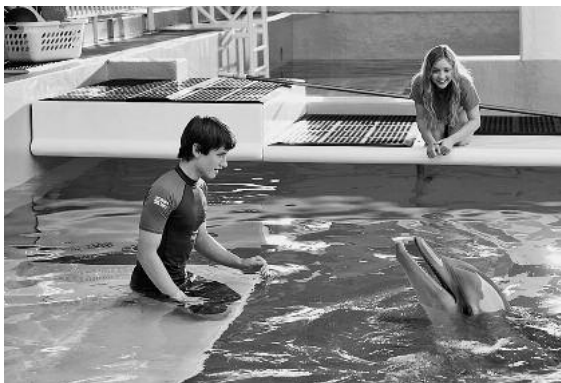
Nach einer wahren, wunderbaren Geschichte