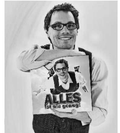
Kabarett der Extraklasse mit Christoph Sieber.

Fernsehen ist, u. a. „Satire Gipfel“ (ARD), „Die Anstalt“ (ZDF), „Mitternachtsspitzen“ (WDR), „Volker Pispers & Gäste“ (3sat). ■