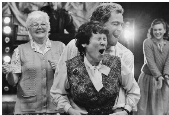
Liebenswerte britische Komödie. Witzig, herzerwärmend, politisch.