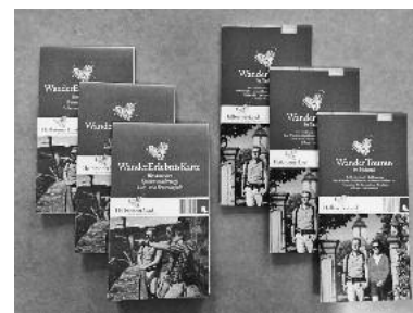
Die neu entwickelte Wandererlebniskarte der TG HeilbronnerLand ergänzt den neu aufgelegten WanderTourenplaner. Beides kostenlos im BBL erhältlich.

am Neckar-Zaber-Stand über viele und bereits sehr gezielte Anfragen von Gruppen, die sich für einen Tagesausflug in die Region interessierten. Der große Renner in diesem Jahr war jedoch die druckfrische kostenlose WanderErlebniskarte mit Wandertouren, Spazierwanderwegen sowie Lehr- und Erlebnispfaden im HeilbronnerLand.