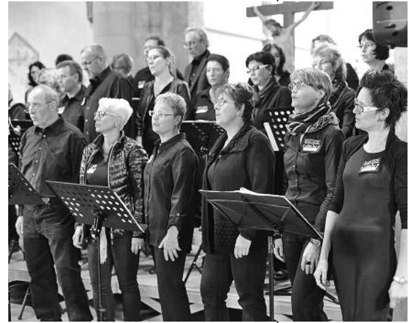
Groovig, berührend, mitreißend – das Jubiläumskonzert zum 10. Geburtstag zeigt die Qualitäten des Gospelchors.

Eine Veranstaltung der Ev. Kirchengemeinde Lauffen a. N. in der Reihe Lauffener Auslese des städtischen Kulturprogramms „bühne frei ...“.