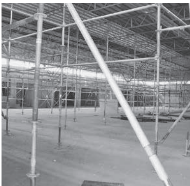
Bauarbeiten in der Dreifeldsporthalle von innen

Bereits im September 2014 wurde nach dem Abbruch der alten Sporthalle und der Förderschule mit dem Rohbau zur Erstellung der neuen Dreifeldsporthalle mit Betreuungszentrum begonnen.