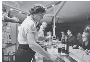
Gerne beraten Sie die einzelnen Weinbaubetriebe an ihren Ständen über ihre besten Tropfen.

seinem weichen, dezenten Schmelz ein frisches und jugendliches Trinkvergnügen. Auch zu empfehlen ist der 2012er Katzenbeißer Schwarzriesling Poet „Friedrich Hölderlin“, der Klassiker aus Lauffen. Er ist sicher der bekannteste Rotwein aus Württemberg. Der Schwarzriesling gilt als Urahn und älteste aller Burgunderreben. Die daraus gekelterten Rotweine begeistern Weinliebhaber mit harmonischer Säure und vollfruchtigen, fast rauchigen Aromen. Im Duft erinnern sie an getrocknete Pflaumen und Brombeeren. Diese trockene Spätlese wurde größtenteils durch traditionelle Weinbereitung wie Maischegärung und Holzfasslagerung veredelt, wodurch Charakter und Lagerfähigkeit des Weines deutlich verbessert sind.