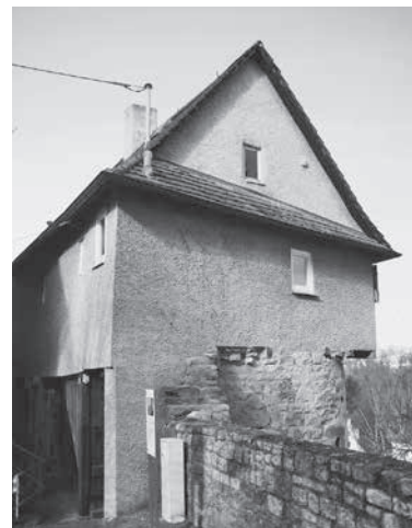
Altes Gefängnis im Städtle

„Engelhansen“ untergebrachten Gefängnis, welches bis in die 50er-Jahre des vorigen Jahrhunderts als Ausnüchterungszelle benutzt wurde. Eine weitere Station ist die heutige Martinskirche, die um 1200 als Nikolauskapelle mit der Gründung des „Städtle“ erbaut wurde. Die Führung kostet für Erwachsene 5 €, Kinder dürfen kostenfrei teilnehmen. Informationen erhalten Sie bei Günter Schlag, Tel.: 07133/8678 oder gug.schlag@web.de. ■