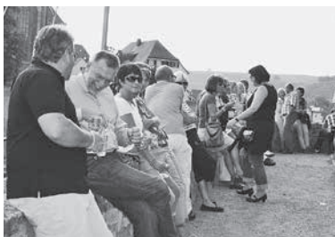
Mit Blick auf den Neckar und die Regiswindiskirche sowie einem Gläschen Wein ergeben sich gute Gespräche.

Welche Tropfen Sie beim Fest unbedingt probieren sollten? Die Weinbaubetriebe stellen ihre Empfehlung vor: