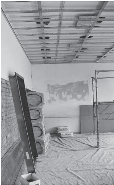
Arbeiten im Klassenzimmer