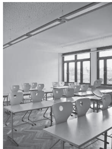
Fertiges Klassenzimmer mit Akustikdecken und intelligenter Beleuchtung

Im Jahr 2016 werden mit dem dritten Bauabschnitt auch die Flure und Treppenhäuser mit Akustikdecken und neuer Beleuchtung ausgestattet.