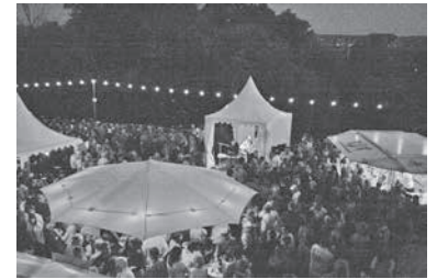
Genuss in herrlicher Atmosphäre – am Abend sorgt das Lichtkonzept für Stimmung.

einen angenehmen Genuss. Auch der 2014er Rosé trocken bietet mit seiner feinen Frucht und nur 11 % vol. pures Vergnügen.