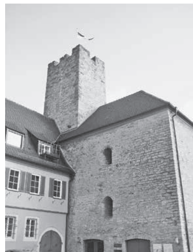
Burgturm mit Burgmuseum

Jede Führung durch Museum und Burg dauert ca. 30 Minuten. Erläutert wird die Entstehung der Burg mit dem heute noch vollständig erhaltenen Wohnturm aus dem 11. Jahrhundert. Im Museum stellen Ausstellungsstücke den Alltag der damaligen Salierzeit anschaulich dar.