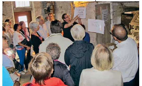
Führung im Erdgeschoss des Hölderlinhauses