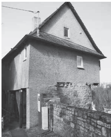
Altes Gefängnis im Städtle

In einer öffentlichen Führung werden am Samstag, 19. September, um 14 Uhr, ausgewählte Besonderheiten des historischen „Städtle“ erschlossen.