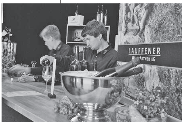
In der vinitiative-Lounge können exklusiv Weine verkostet werden.

Lauffener Weintage laden zum berühmten Weinfest ein – mehr als 80 Weine und Sekte können verkostet werden.