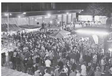
Lauffener Weintage locken Besucher aus nah und fern.

Genießen, Probieren und Feiern von Samstag, 16. bis Montag, 18. April