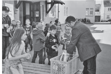
Nach der Arbeit gab es zur Belohnung Brezeln und Getränke.

Nachdem die fleißigen Helfer in Gruppen eingeteilt und einem zuvor bestimmten Gebiet zugeordnet wurden, machten sie sich direkt ans Werk, um die Straßen der Stadt von Unrat zu befreien. Mit Handschuhen und Müllzangen ausgerüstet füllten sich die Müllsäcke in kürzester Zeit.