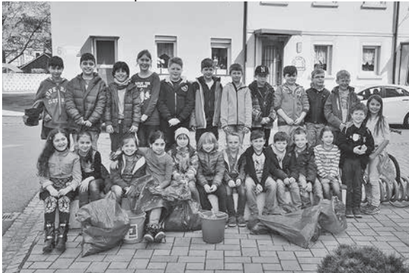
Wie die Klasse 3b der Herzog-Ulrich-Grundschule waren viele Kinder und Jugendliche mit Spaß bei der Aktion dabei.

Um ein sauberes Stadtgebiet zu schaffen, versammelten sich rund 300 Schülerinnen und Schüler mit ihren Lehrerinnen und Lehrern und Begleitern in den Pausenhöfen ihrer Schulen. Die Aktion wurde in diesem Jahr von der Kaywald-Schule, der Hölderlin-Realschule, der Hölderlin-Werkrealschule, der Erich-Kästner-Schule und den beiden Grundschulen mit Hort unterstützt.