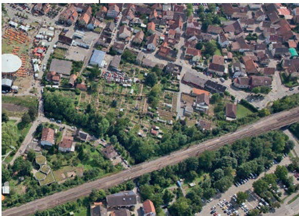
Freiraumkonzept Kiesgärten: Bereits 2014 wurde unter Bürgerbeteiligung ein Rahmenkonzept für die Kiesgärten erarbeitet“

Sämtliche Informationen zur Sanierung finden Sie auch auf der Lauffener Homepage unter www.lauffen.de/website/de/wohnen_und_arbeiten/bauen_und_sanieren/gebäude-sanierung .