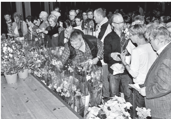
Die letzte Preisvergabe erfolgte im Rahmen des Blumenschmuckwettbewerbs 2015.

Viele Gemeinden haben in den sechziger Jahren im Rahmen der Maßnahmen zur Ortsverschönerung Wettbewerbe zur Prämierung von Blumenschmuck in Häusern und der optisch guten Bepflanzung von Vorgärten eingeführt. Im Lauffen a.N. wurde der sogenannte „Blumenschmuckwettbewerb“ erstmals 1965 eingeführt. 1988 wurde der Blumenschmuck-Wettbewerb offiziell in „Wettbewerb zur Stadtverschönerung durch Blumen und Grün“ umbenannt. Die Bewertungsrundgänge wurden in den letzten Jahren unter dem Vorsitz des Leiters von Bauhof und Stadtgärtnerei, Herrn Bernhard Richter, durchgeführt.