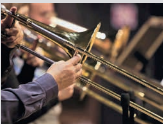
Das Reformationsjubiläum wird mit einem gemeinsamen Konzert von Posaunenchor, Kirchenchor und Gospelchor am 2. Juli im großen Rahmen gefeiert

Daher bitten Stadtverwaltung und Kirchengemeinde alle Vereine, Institutionen oder Privatpersonen, die für 2017 in Lauffen a.N. Veranstaltungen oder Aktionen rund um das Reformationsjubiläum und Martin Luther planen, ihre Veranstaltungen bei der Stadtverwaltung einzureichen.