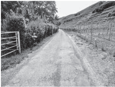
Durch den Ausbau soll die Wegequalität für Radfahrer verbessert werden.

den Radkarten der Touristikgemeinschaft trägt der Weg die Bezeichnung „Wein-Land-Fluss-Tour „(N1).