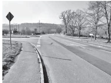
Eine neue Querungsstelle an der alten Eiche soll die Sicherheit verbessern.

Grundsätzlich wäre eine bituminöse Ausbaubreite von 4,0 m anzustreben um allen Nutzungsansprüchen gerecht zu werden. Da der Weg zwischen 2,5 m und 3,5 m abgemarkt ist, würde bei einer Ausbaubreite von 4,0 m (Gesamtbreite einschl. Bankett = 5,0 m) durchgängig Grunderwerb erforderlich werden. Dies ist vermutlich nur schwer durchzusetzen. Es ist deshalb geplant den Weg auf eine Grundbreite von 3,0 m (Gesamtbreite 4,0 m einschließlich Bankett) auszubauen. Das Bankett wird mit