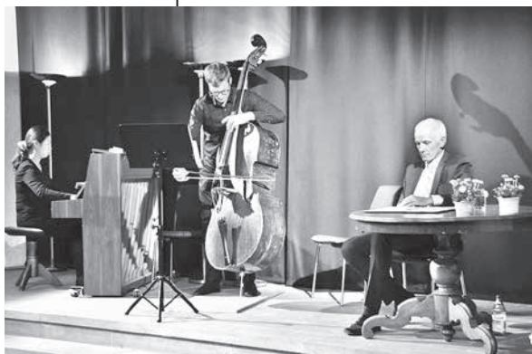
An Umfang und Qualität gleichwertig, war der musikalische Part des Abends.