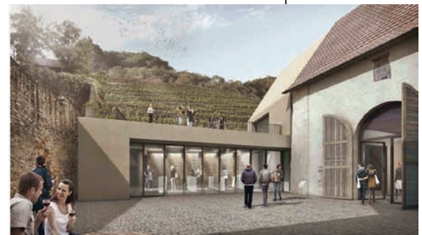
Perspektive Neubau z.BA