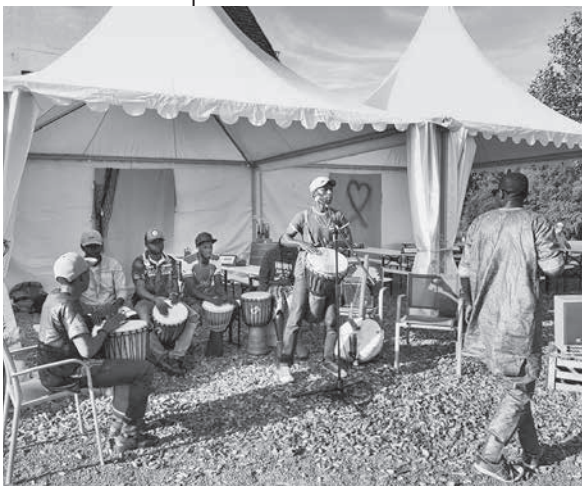
Gambianische Musiker aus Lauffen und Talheim.

Das Wetter und die Musik spielen am ersten After-Work Abend der noch jungen Saison im Gleichklang. Die Gruppe, bestehend aus