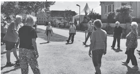
Momentaufnahme Mai 2018

Bewegungstreffs im Freien, das ist Spaß an der Bewegung, Gesundheit und Geselligkeit!