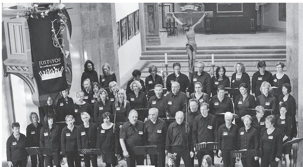
Dem Frieden Raum geben in einer Welt des Unfriedens: Mit unsterblichen Popsongs, Gospels und Spirituals macht der Lauffener Gospelchors JUST4YOU die Sehnsucht nach Frieden hörbar.

Eine Veranstaltung der ev. Kirchengemeinde im Rahmen des städtischen Kulturprogramms „bühne frei...“. ■