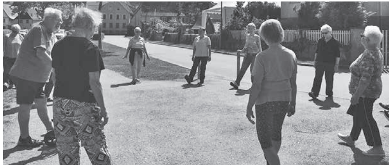
Momentaufnahme Mai 2018

Das Angebot ist kostenlos und unverbindlich – eine Anmeldung ist nicht