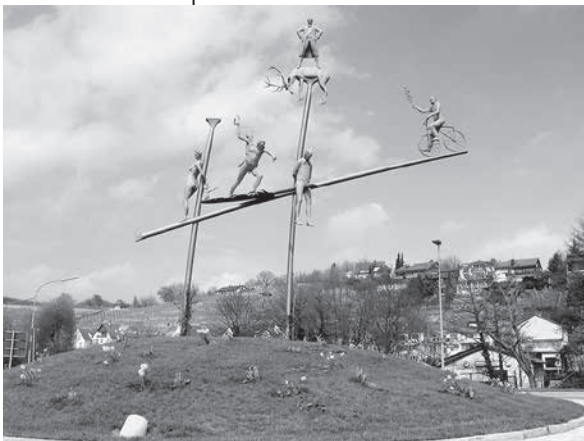
Hölderlin im Kreisverkehr

Diese öffentliche Führung zeigt den Gästen Orte und schildert Ereignisse, die eng mit den Personen Hölderlin und Regiswindis verbunden sind. Friedrich Hölderlin: Der berühmte, 1770 in Lauffen geborene Dichter und Philosoph. Das siebenjährige Mädchen Regiswindis: Nach dem gewaltsamen Tod im Jahre 839 stieg sie um 1000 zur katholischen Ortsheiligen auf. Beide Personen haben die Entwicklung von Lauffen bis in die heutige Zeit maßgeblich geprägt.