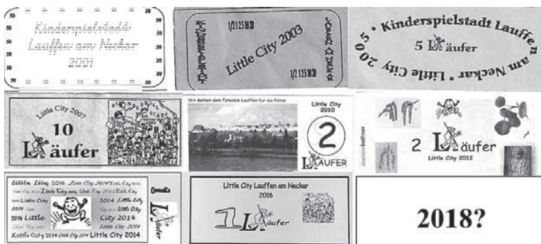
Foto des Jahres 2018