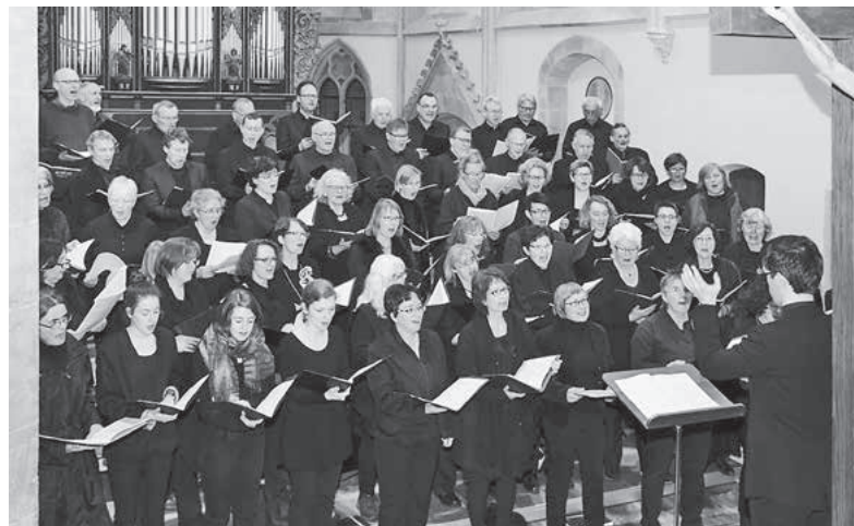
Engagierte ChorsängerInnen, ein hochkarätig besetztes Orchester und ein musikalisches Meisterwerk von Felix Mendelssohn Bartholdy versprechen ein besonderes Konzerterlebnis.

Der begabteste musikalische Streichernachwuchs der Lauffener Musikschule bereichert die Aufführung zusätzlich. Alle musizieren unter der Leitung des Lauffener Kantors Andreas Willberg. Eine Veranstaltung der Ev. Kirchengemeinde Lauffen a.N. in Kooperation mit der Musikschule Lauffen a.N. und Umgebung im Rahmen des städtischen Kulturprogramms „bühne frei...“ ■