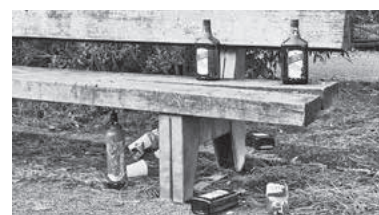
Das Bild zeigt beispielhaft eine Situation nach einem Saufgelage an der Bank Katharinenstraße/Asthmastaffel.

tuosen an Personen unter 18 Jahren ausgibt oder diesen den Genuss in der Öffentlichkeit ermöglicht, handelt nach den Vorschriften des Jugendschutzgesetzes und Landesnichtraucherschutzgesetzes ordnungswidrig. Der Vollzugsdienst der Stadt Lauffen a.N. wird auch weiterhin im Rahmen der personellen Möglichkeiten unregelmäßige Kontrollen durchführen. Sollten Sie als AnwohnerInnen sich in den Nachtstunden durch den Lärm des „feiernden Volkes“ erheblich gestört fühlen, wenden Sie sich bitte an das Polizeirevier Lauffen a.N.