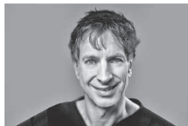
Ingolf Lück

Sittler und Mariele Millowitsch ist am Freitag, 18. Januar 2019, um 20 Uhr in einem seiner seltenen gemeinsamen Live-Auftritte in der Lauffener Stadthalle zu erleben. Karten gibt es nur noch in Kategorie 2 für 24 €, ermäßigt 14 €. Komischer als in dem Roman ALTE LIEBE von Elke Heidenreich und Bernd Schroeder sind die Szenen einer Ehe noch nicht erzählt worden: Mit klugem Witz und heiterem Ernst spiegeln sie die Geschichte einer in die Jahre gekommenen Liebe.