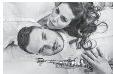
Jerusalem Duo

Genauso hochkarätig geht das Programm im Februar weiter. Comedy-Altmeister Ingolf Lück ist vier Jahre nach „Ach Lück mich doch“ mit seinem neuen Programm „Sehr erfreut!“ wieder auf den Kabarett- und Comedybühnen des Landes zurück. Und diesmal wird ausgeteilt! Charmant, aber direkt seziert er eine Welt, die sich so schnell dreht, dass es sich manchmal lohnt, einfach stehen zu bleiben, sich umzuschauen und auf die nächste Bahn zu warten. Karten für diesen intimen Comedyabend im Lauffener Museum im Klosterhof am Samstag, 2. Februar, um 20 Uhr gibt es für 22 € (ermäßigt 11 €).