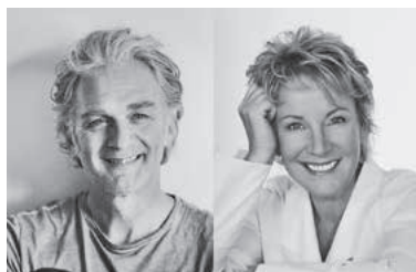
Walter Sittler & Mariele Millowitsch

Hier die Veranstaltungen der ersten Jahreshälfte: