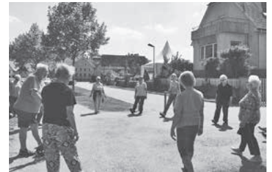
Momentaufnahme Mai 2018