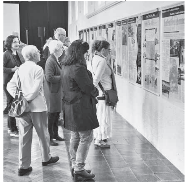
Die Ausstellung, die auch besonders für Jugendliche und Schulklassen geeignet ist, ist noch bis Ostermontag im Museum im Klosterhof zu sehen.