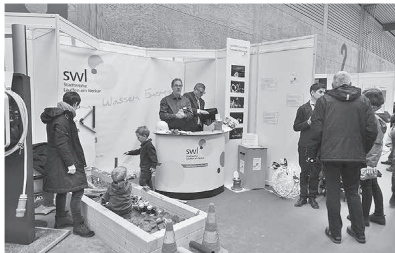
Messestand der Stadtwerke Lauffen