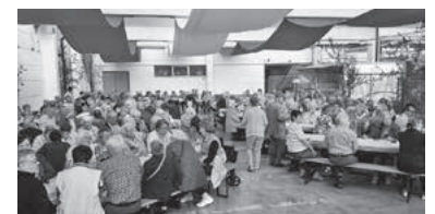
Impressionen aus dem Jahr 2018

Die Stadt Lauffen a.N. und der Männergesangsverein Urbanus Lauffen a.N. e.V. laden mit Unterstützung der Lauffener Weingärtner eG, am Montag, 15. April ab 14 Uhr auf dem Gelände der Lauffener Weingärtner eG, Im Brühl 48, gemeinsam zum Seniorennachmittag ein.