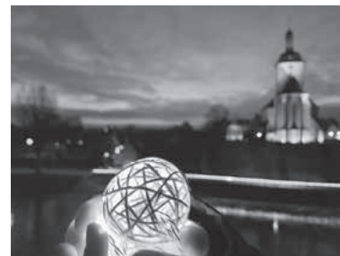
Siegerfoto Wettbewerb „Lauffen leuchtet“

Ein weiteres Highlight am Stand der SWL war die Wahl der Gewinner des Fotowettbewerbs „Lauffen leuchtet“. In der Vorweihnachtszeit hatte die SWL die Lauffener Bürger dazu eingeladen, ihre Fotografien rund um das Thema „Lauffen leuchtet“ einzureichen. Zahlreiche Motive rund um die Innenstadt, am Kreisver-