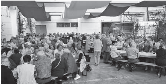
Impressionen aus dem Jahr 2018

Ab 14 Uhr auf dem Gelände der Lauffener Weingärtner eG; mit Kaffee und Kuchen