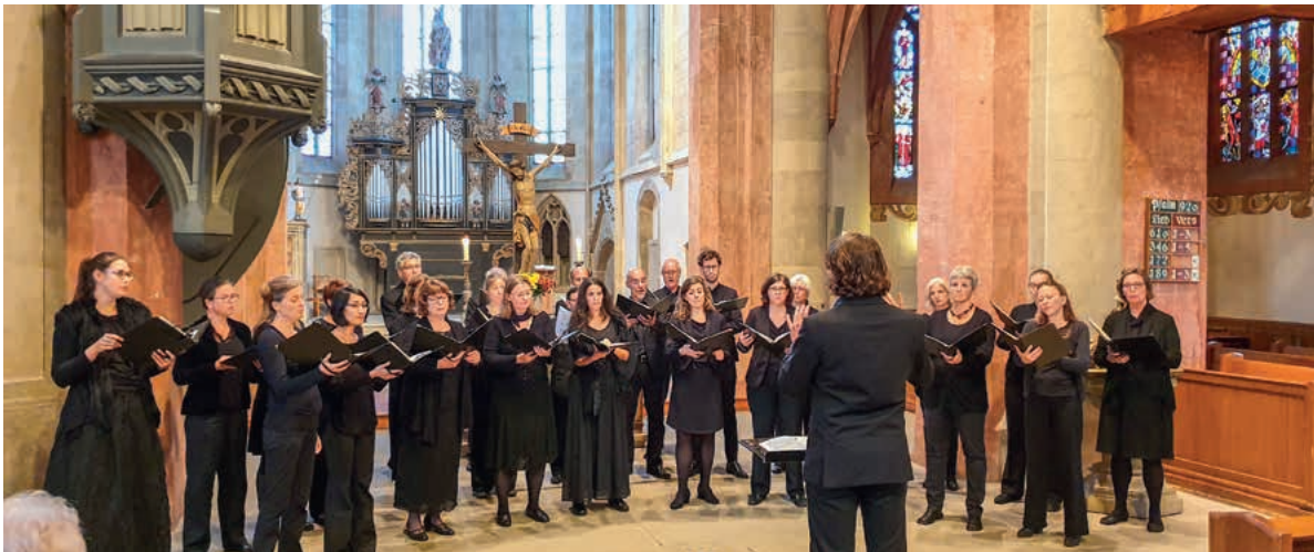
Der Chor beeindruckte durch seinen runden Gesamtklang, der dennoch jederzeit klar und transparent blieb.

Der Freiburger Kammerchor begeistert mit einem zeitgenössischen „Te Deum“