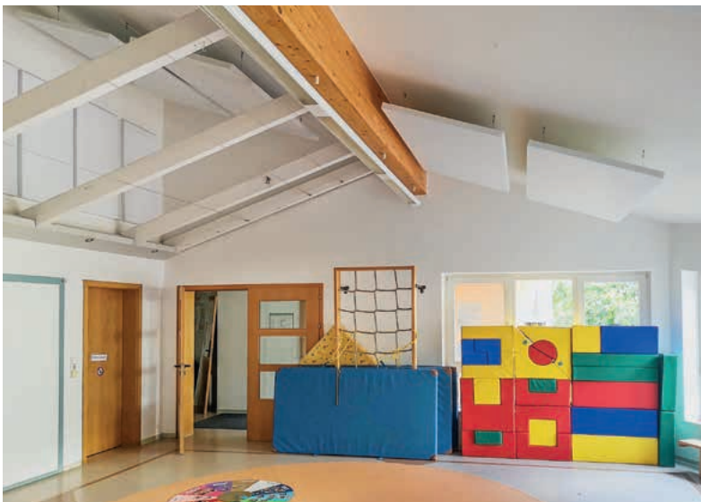
Die Turnhalle im Kindergarten Herrenäcker wurde hell gestrichen und mit Schallschutzelementen versehen.

Zuvor wurde die Stadthalle, die derzeit durch die Maßnahmen zur Corona-Pandemie nicht für die üblichen Zwecke genutzt werden kann, mit Regalen aufgebaut, die für die Tätigkeit der Digitalisierung erforderlich sind. ■