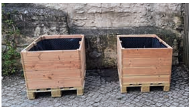
Hochbeete im Kindergarten Städtle

So können sich die Kinder im Kindergarten Städtle bei ihrer Rückkehr über ein neues Holzdeck freuen. Das alte wurde mit der Zeit morsch. Die Hoffläche wurde aus Terrassendiehlen mit einem neuen Boden belegt. Ergänzend wurden zwei Hochbeete aufgestellt, die von der Volksbank im Unterland eG gespendet wurden.