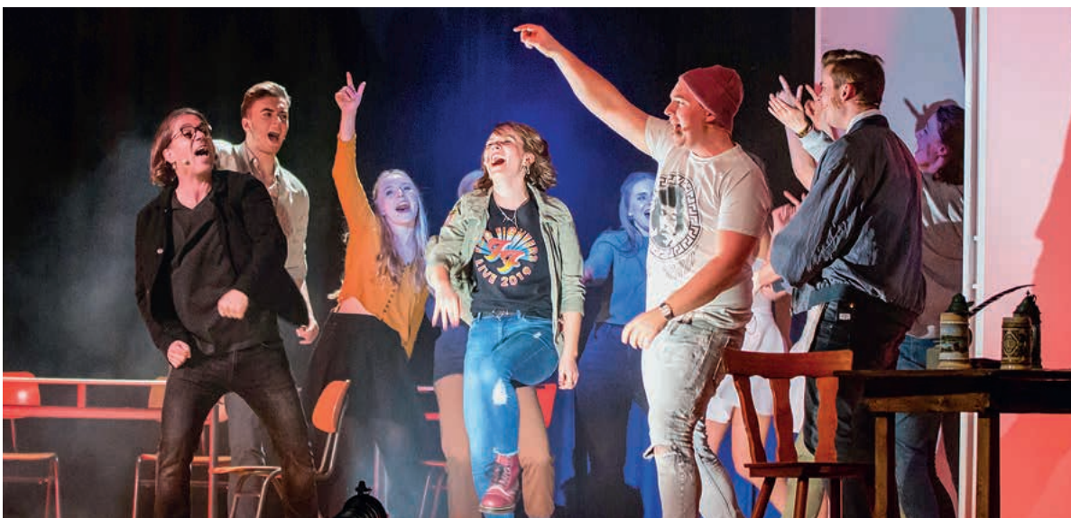
Ein Dichter aus Lauffen für die ganz großen Bühnen: Das Hölder-Rockmusical-Ensemble gastiert am 5. Oktober mit dem Hölderlin-Musical im großen Saal des Theaterhauses Stuttgart.

Ensemble und Fans freuen sich auf die Wiederaufnahme des Erfolgsstücks des Hölderlinjahres!