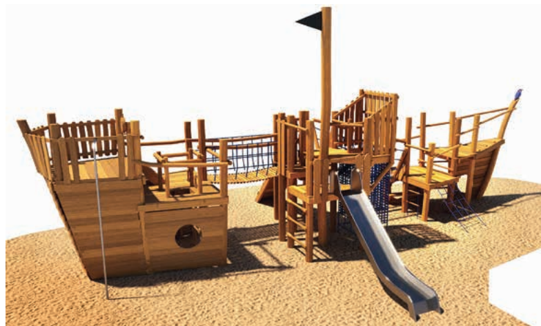
Das neue Spielschiff dient als Ersatz für die alte Kletterspinne.

Bürgerinnen und Bürger, die diese Freiwilligkeitsleistung der Stadt für die Lauffener Kinder mit einer Spende unterstützen wollen, können gerne weiterhin einen Betrag ihrer Wahl auf das städtische Konto mit dem Stichwort „Spielschiff Kies“