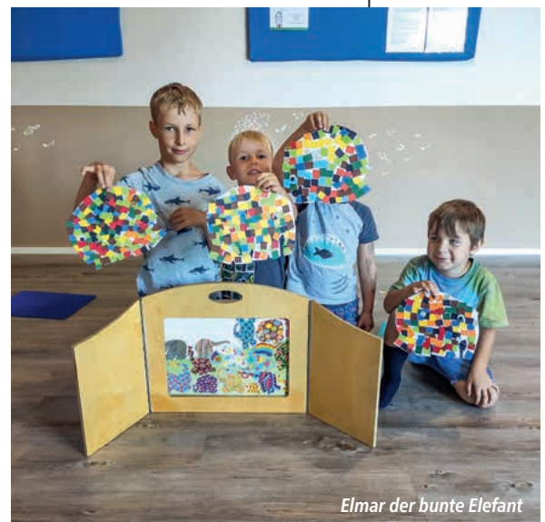
Elmar der bunte Elefant