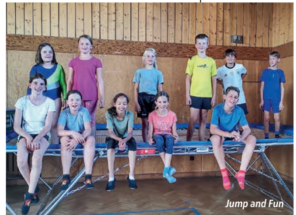
Jump and Fun