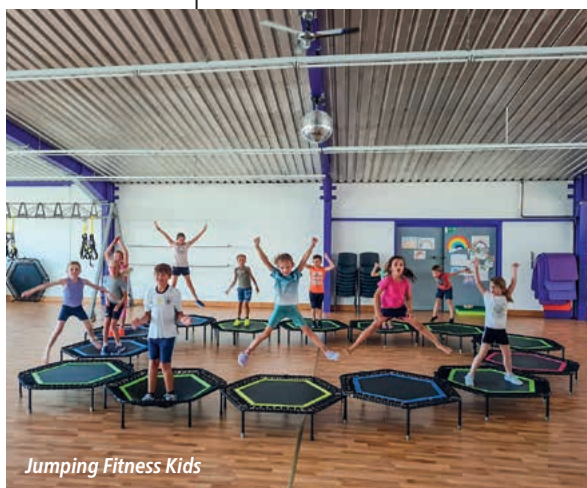
Jumping Fitness Kids