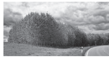
„Black ist the color“ Fotografie von Richard Becker 21. August bis 3. Oktober 2022 Vernissage: 21. August 15 Uhr

Beckers Bilder rütteln uns auf und fordern uns auf, doch nochmal genauer hinzuschauen, was wir da sehen. Er wirft einen scharfen Blick auf die Kultur-Landschaft von heute, auf die Burgen von heute, auf den Neckarstrand, auf das was bleibt, nachdem die weiten Nutzflächen abgeerntet wurden. Richard Becker zeigt uns ganz bewusst gewählte Ausschnitte, die wir so wahrscheinlich noch nie wahrgenommen haben.“