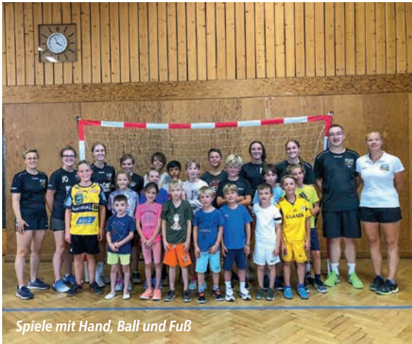
Spiele mit Hand, Ball und Fuß