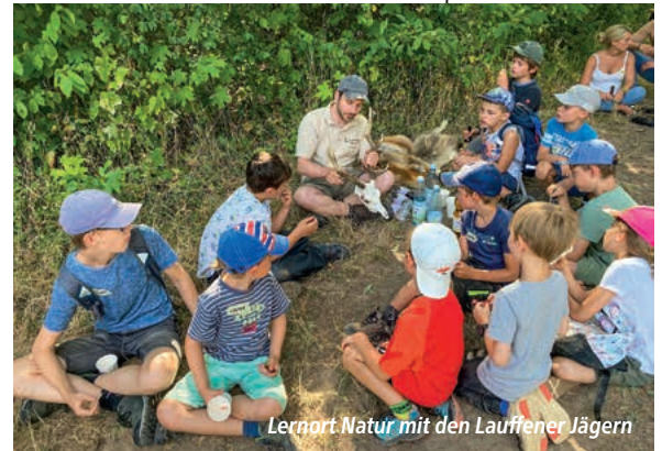
Lernort Natur mit den Lauffener Jägern