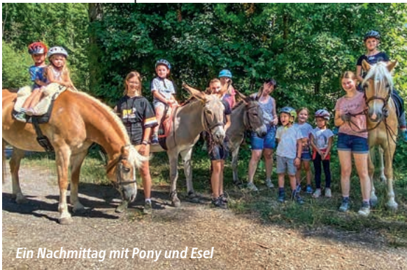
Ein Nachmittag mit Pony und Esel