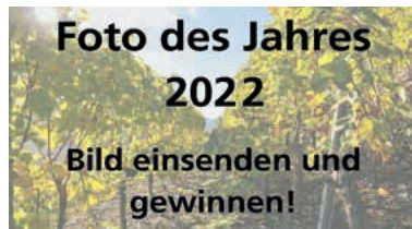
Foto des Jahres 2022

Senden Sie uns Ihr Lieblingsfoto/ Ihre Lieblingsfotos ein, die im jeweiligen Monat aufgenommen wurden. Nutzen Sie die Tage im sommerlichen Licht für Ihr besonderes Foto von Lauffen a.N.