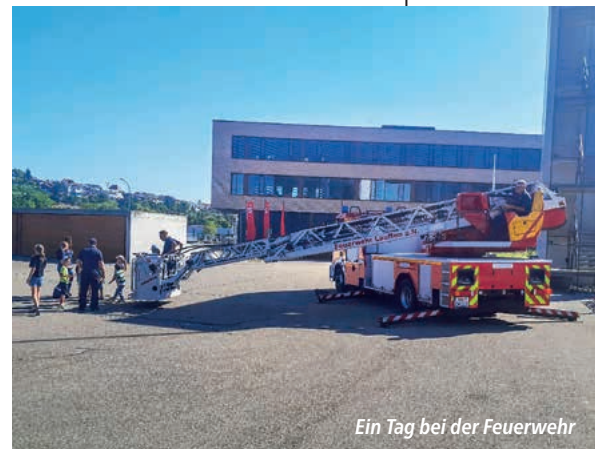
Ein Tag bei der Feuerwehr