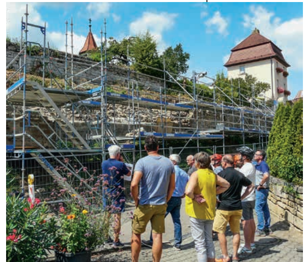
Gemeinderat vor der imposanten östlichen Schiedmauer der Lauffener Stadtbefestigung

Die Stadtmauer ist aber nicht die einzige historische Befestigung der Stadt, ebenfalls in den vergangenen Jahren erfolgte die aufwändige Sanierung der Regiswindismauer, der Rathausmauer sowie der Klosterhofmauer zwischen Haus Edelberg und dem Hölderlinhaus. Im vergangenen Jahr wurde die nördliche Klosterhofmauer zum Geigersberg hin notgesichert, auch hier stehen in der Zukunft aufwändige Sicherungsarbeiten an. Die wichtigste Entscheidung im Aufgabenbereich Denkmalpflege im