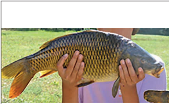
Ein Tag beim Fischereiverein