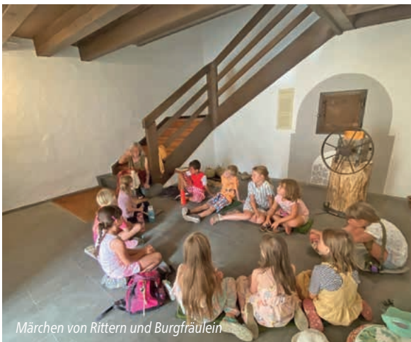
Märchen von Rittern und Burgfräulein