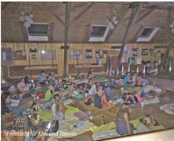
Filmnacht für Kids und Teenies