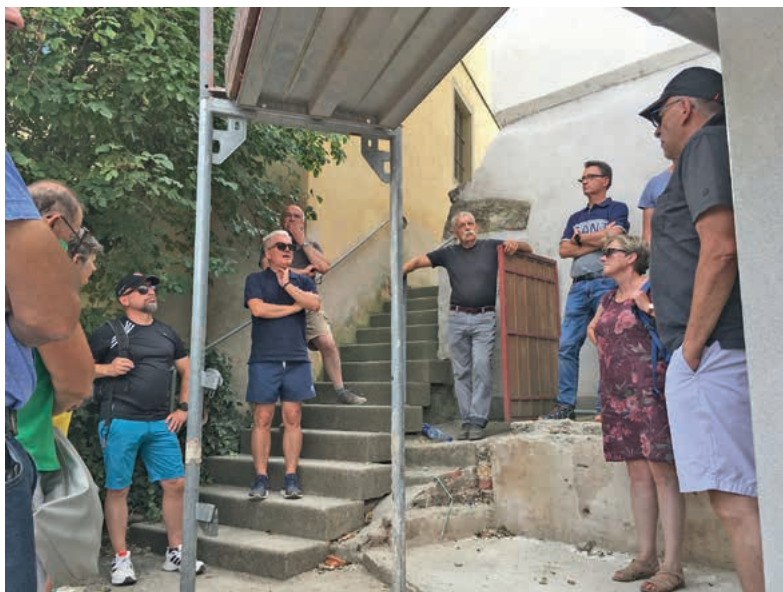
Von der Treppe zur Regiswindiskirche aus erreicht man den neu geschaffenen kleinen Vorplatz der Kiesstrasse 7.

Text: Klaus-Peter Waldenberger, Anregungen und Rückfragen an: k.p.waldenberger@lauffen.de