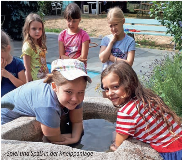
Spiel und Spaß in der Kneippanlage