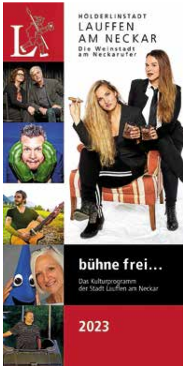
Das „bühne frei...“-Programm 2023

Und wenn Sie Vorfreude schenken wollen ohne sich oder die/den Beschenkte/n schon zu sehr festzulegen, dann liegen Sie mit „bühne frei...“-Geschenkgutscheinen immer richtig. Erhältlich im Bürgerbüro oder online unter www.lauffen.de/gutscheine . ■