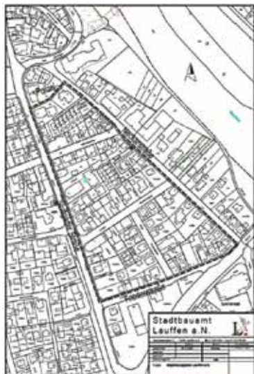
Östliche Stuttgarter Straße

Der Gemeinderat fasste zur Vorlage 2022 Nr. 126 folgenden einstimmigen Beschluss: