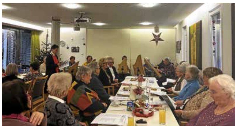
Weihnachtsfeier in der Begegnungsstätte