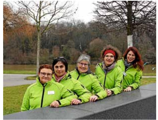
Die fünf Übungsleiterinnen des Bewegungstreffs 2018 mit hellgrünen Jacken am Kiesplatz.

Zum Jahresabschluss am 23. Dezember gibt es nach dem Treff Glühwein und Punsch. Bitte eigenen Becher mitbringen. ■