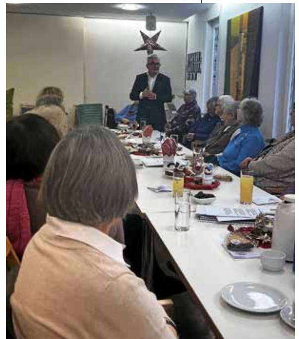
Weihnachtsfeier in der Begegnungsstätte