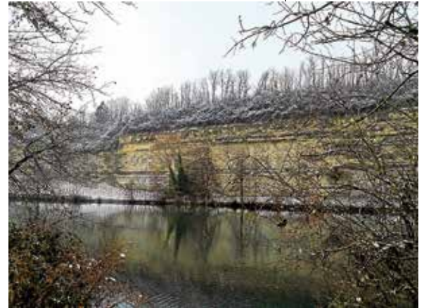
Blick auf den Prallhang

Informationen bei und Anmeldung erbeten an Helga Naujoks, Telefon