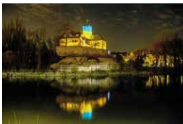
Hansjörg Sept: Für mehr Frieden auf der Welt