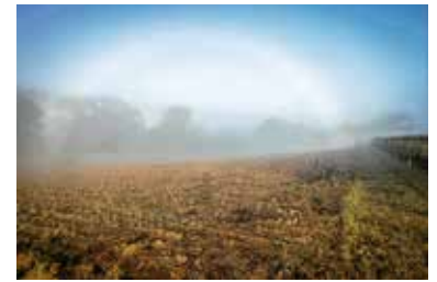
Werner Ohsam: Nebelbogen an der Kaywaldschleife