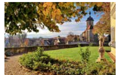
Frank-Michael Zahn: Regiswindiskirche im Herbst