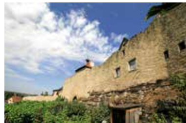
Altes Heilbronner Tor

Sonntagsführung am 26. März um 15 Uhr: „Perlen im Lauffener Städtle“