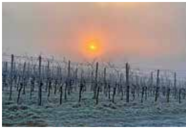
Manuela Krautwasser – Winter im Weinberg

Stimmen Sie ab für Ihr Foto des Jahres 2022 Wählen Sie nun bis einschließlich 10. April Ihren Favoriten, Ihr Foto des Jahres 2022 aus 12 Monatsbildern, die eine Jury der Verwaltung ausgewählt hat.