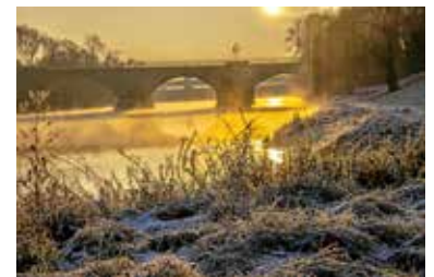
Hansjörg Sept: Rauheifmorgen

Wählen Sie aus und geben sie Ihrem Favoriten die Stimme. Einfach unter www.lauffen.de Wahl zum Foto des Jahres 2022 Ihr Lieblingsfoto aus-