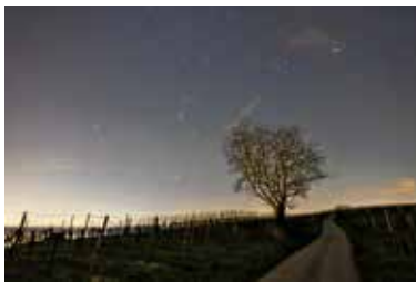
Ulrich Seidel: Sternenhimmel über den Weinbergen von Lauffen a.N.