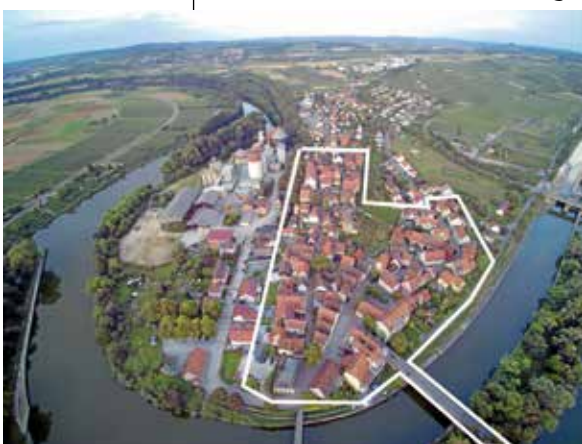
Ungefähre Abgrenzung des Sanierungsgebietes Lauffen V (Städtle)

die STEG Marion Bürkle 07131/964012 marion.buerkle@steg.de Stadtbauamt Helge Spieth 07133/106-36 spiethh@lauffen-a-n.de ■