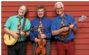
Bei „Matching Ties“ sind drei der führenden Folk-Musiker der europäischen Szene in einer Band versammelt.