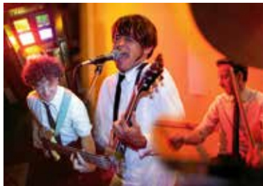
The Gimmicks – koi normale SFL-Band

Samstags ab 14 Uhr können die Stände im Städtle besucht werden, offizieller Festbeginn ist um 17 Uhr im Burghof des Lauffener Rathauses. Eröffnet wird das Fest wieder mit der Stadtkapelle und der Böllergruppe des Schützenvereins. Direkt nach der Eröffnung ist Eigeninitiative gefragt. Man kann um 18 Uhr entweder beim Mit-Sing-Ding des Gesangverein Urbanus mitmachen oder bei der Open-Stage der ZEAG Energie-Jugendbühne auf dem Parkdeck selbst auftreten.