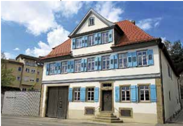
Die Bauhistorie des Hölderlinhauses steht im Fokus der Architekturführung am 1. Juli mit Klaus Koch

Entdecken Sie mit Gästeführer Klaus Koch die Besonderheiten des architektonischen Juwels Hölderlinhaus am 1. Juli