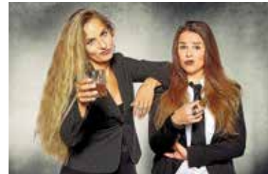
Das Cabarett-Duo „Suchtpotenzial“ ist mit einem seiner wenigen Auftritte in diesem Jahr mit dem Programm „Sexuelle Belustigung“ in Lauffen live zu erleben.

Am Samstag, 8. Juli , folgt um 19 Uhr das Sommernachtskonzert der Musikschule Lauffen a.N. und Umgebung. Für die Open-Air-Bühne haben die Lehrerinnen und Lehrer ein sehr breites musikalisches Spektrum vorbereitet: Von Bach und Schubert über Ferenc Farkas bis Carlos Santana und Antonio Carlos Jobim reicht die Bandbreite, dargeboten mit Gitarre, Cello, verschiedenen Blasinstrumenten, Violine, Klavier und natürlich Gesang. Damit ist ein kurzweiliger, abwechslungsreicher Abend garantiert! Der Eintritt ist frei – um Spenden für den Förderverein wird gebeten. Kostenlose Tickets gibt es unter www.lauffen.de/tickets .