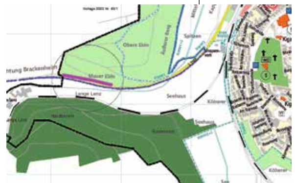
Feldwegsperrung Mauer Ebin