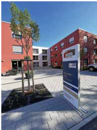
Alexanderstift im Generationenquartier Bismarckstraße