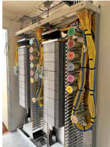
Verschiedene Hausanschlüsse in einem PoP

rungen die durch den Ausbau entstehen, entschuldigt werden.