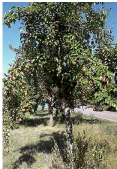
Ran an das Obst – ernten erwünscht!

Wer sich über die Grenzen Lauffens hinaus für das straflose Ernten von Obst interessiert, kann sich auf der Seite https://mundraub.org/ schlau machen.