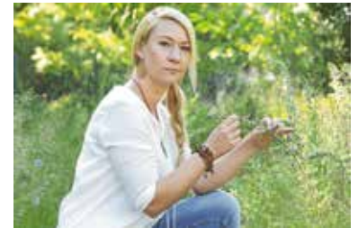
Eine blonde Frau sitzt mit einer Wildblume in der Hand mitten in einer Wiese