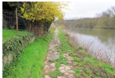
Treidelpfad am Neckar