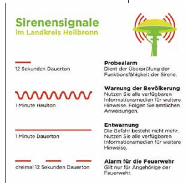
Sirensignale im Landkreis Heilbronn

gegen 11 Uhr die Sirenen mit einem einminütigen auf- und abschwellenden Heulton ausgelöst. Das Ende des Probealarms wird mit einem 12 Sekunden langen Dauerton der Sirenen angezeigt. Das Bundesamt für Bevölkerungsschutz und Katastrophenhilfe wird außerdem eine Warnmeldung über alle verfügbaren Warnmittel, wie Radio, Fernsehen, Internetseiten, Social Media, digitale Stadtanzeigtäfel, Lautsprecherwagen, Warn-Apps und Cell Broadcast aktivieren. Weitere Informationen sind unter www.warnung-der-bevoelkerung.de abrufbar.