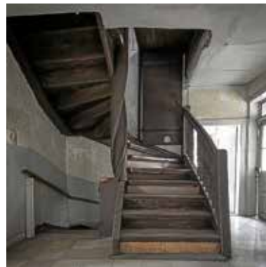
Die große Treppe des Hölderlinhauses vor der Sanierung

Die Themenführung mit Gästeführer Hartmut Wilhelm präsentiert ausgewählte (bauliche) Aspekte auf dem Weg vom Wohnhaus zum Museum: