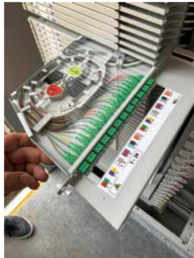
Beispiel eines Hausanschlusses

den. Alles läuft hier zusammen. Des Weiteren werden im Stadtgebiet noch bis zu 90 Verteilerkästen gebaut, die die Glasfaserversorgung langfristig sichern.