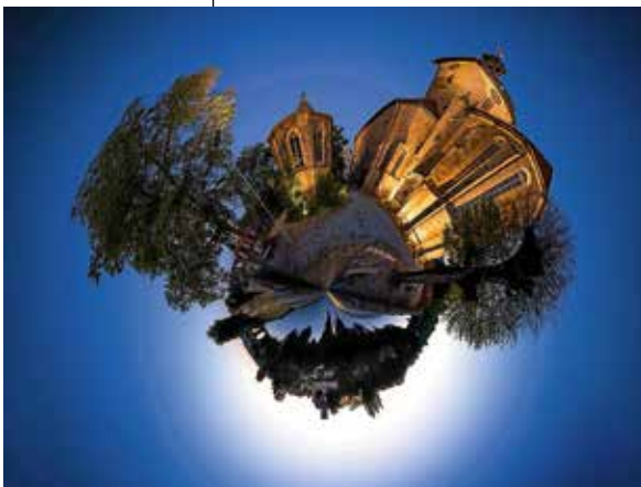
aus dem Wettbewerb zum Foto des Jahres 2022

Diese öffentliche Führung zeigt den Gästen Orte und schildert Ereignisse, die eng mit den Personen Hölderlin und Regiswindis verbunden sind. Friedrich Hölderlin: Der berühmte, 1770 in Lauffen geborene Dichter und Philosoph. Das siebenjährige Mädchen Regiswindis: Nach dem gewaltsamen Tod im Jahre 839 stieg sie um 1000 zur Ortsheiligen auf. Beide Personen haben die Entwicklung von Lauffen bis in die heutige Zeit maßgeblich geprägt.