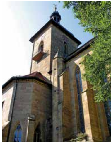
Regiswindiskirche, Außenansicht mit Blick auf die gotischen Spitzbogenfenster

Im Jahre 1140 begann mit dem Bau der Kathedrale von St. Denis bei Paris eine neue Zeitepoche: die Gotik. 1208 mit dem Neubau des abgebrannten romanischen Doms in Magdeburg und 1227 mit der völlig neu geplanten Kirche zu Ehren der Heiligen Regiswindis in Lauffen setzte sich auch in Deutschland dieser neue Baustil durch.