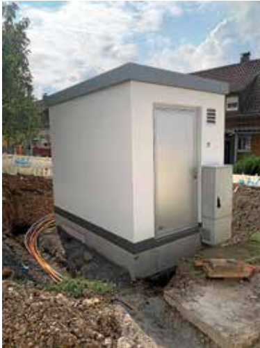
Ansicht PoP mit Glasfaserkabeln

Rund um den Sandweg sind die ersten Gräben bereits wieder verschlossen. In ihnen liegt die Zukunft! Glasfaser für Lauffen a.N. Der Ausbau verläuft derzeit grob nach Zeitplan. Die Deutsche Gigasetz arbeitet Schritt für Schritt mit ihren Subunternehmen die Straßenzüge ab.