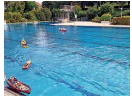
Wir freuen uns schon jetzt auf eine sonnige Badesaison 2024!