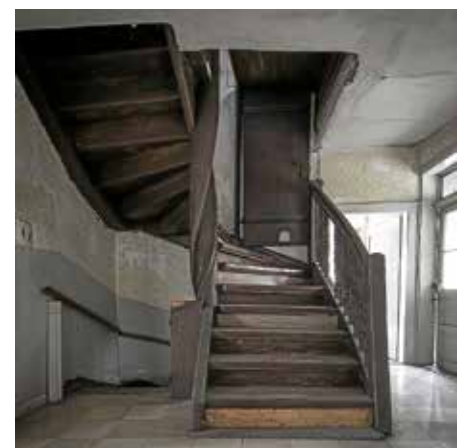
Die große Treppe des Hölderlinhauses vor der Sanierung

Zu erleben ist die Führung im Rahmen der Veranstaltungsreihe der Kulturregion HeilbronnerLand am Samstag, 23. September von 15 bis ca. 16 Uhr. Treffpunkt ist um 14.45 Uhr am Parkplatz 6 „Hagdol“, Nordheimer Straße. Die Teilnahmegebühr beträgt 5 €, Kinder frei. Der Gästeführer freut sich über eine Anmeldung unter Tel. 07133/5869 oder per E-Mail an hawi43@web.de , aber auch eine spontane Teilnahme an der Führung ist mög-