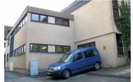
Heilbronner Straße 32: Ein städtisches Projekt soll die energetische Sanierung des Kindergartens im Städtle sein.

rat im Frühjahr 2024 die Sanierungssatzung und die Fördersätze als Voraussetzung für die Durchführung der Sanierung beschließen kann. Bereits an dieser Stelle sei noch einmal darauf hingewiesen, dass Fördermittel nur in Anspruch genommen werden können, wenn vor der Beauftragung von Firmen eine Sanierungsvereinbarung mit der Stadt abgeschlossen worden ist. Nachträgliche Förderungen sind nicht möglich.