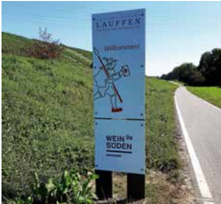
Willkommensstelen heißen ab sofort an den Gemarkungsgrenzen Radler in Lauffen a.N. willkommen

Die Autofahrer kennen sie bereits, auf den Radwegen sind sie neu: Im August wurden von der Stadtverwaltung entlang der meistbefahrenen Radwege an den Gemarkungsgrenzen Willkommenstafeln aufgestellt. Gerade auf dem Neckartalradweg, aber auch auf den Radwegen Richtung Nordheim oder Brackenheim-Hausen, sind jährlich viele Zehntausend Radfahrerinnen und Radfahrer unterwegs. Nun werden sie in der Hölderlin- und Weinstadt am Neckarufer nicht nur freundlich begrüßt, sondern auch genauso freundlich verabschiedet. Dass sie sich in Lauffen in einem Weinsüden-Weinort befinden und damit Weinkultur, Weinerlebnisse und Weingenüsse erwarten dürfen, wird ebenfalls angekündigt.