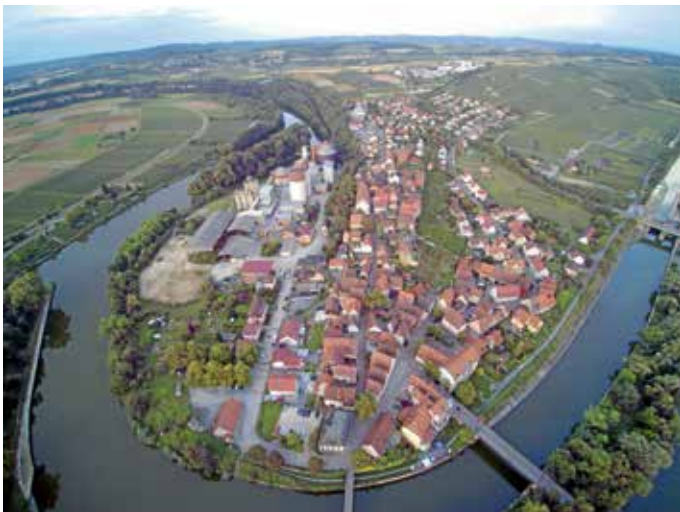
Das neue Sanierungsgebiet Lauffen V „Städtle“ umfasst im Wesentlichen die Altstadt

die STEG Marion Bürkle, 07131/964012 marion.buerkle@steg.de Stadtbauamt Helge Spieth, 07133-106-36 spiethh@lauffen-a-n.de