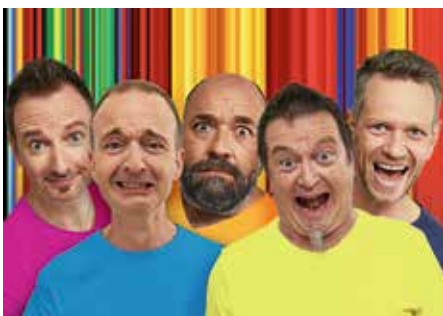
Die Füenf – die genialen Schöpfer der Schwabenhymne „Mir im Süden“ – machen auf ihrer Abschiedstour „Endlich!“ Station in der Lauffener Stadthalle

Schluss nach 25 Jahren: Letzter Live-Auftritt in Lauffen a.N. am 6. Oktober in der Stadthalle