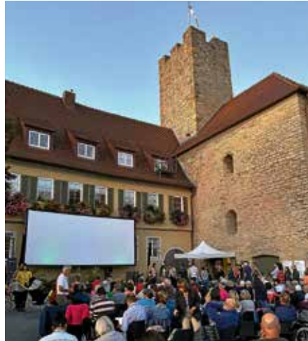
Perfekter Saisonabschluss bei bestem Wetter vor malerischer Kulisse

Für die Organisatoren des Kinos war es eine Herausforderung, möglichst allen Besuchern kurzfristig einen Sitzplatz zu organisieren und gleichzeitig auch eine wunderbare Bestätigung, dass das Open-Air-Kino in Lauffen a.N., seit seinem Start im vorletzten Jahr, doch schon so viele Fans gefunden hat.