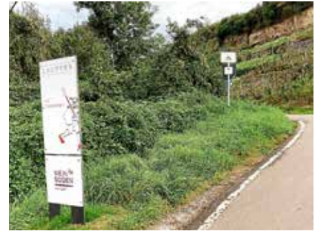
Beim Verlassen der Ortsgrenzen werden die Radfahrer aus dem Weinsüden-Weinort verabschiedet.

Die Autofahrer kennen sie bereits, auf den Radwegen sind sie neu: Im August wurden von der Stadtverwaltung entlang der meistbefahrenen Radwege an den Gemarkungsgrenzen Willkommenstafeln aufgestellt. Gerade auf dem Neckartalradweg, aber auch auf den Radwegen Richtung Nordheim oder Brackenheim-Hausen, sind jährlich viele Zehntausend Radfahrerinnen und Radfahrer unterwegs. Nun werden sie in der Hölderlin- und Weinstadt am Neckarufer nicht nur freundlich begrüßt, sondern auch genauso freundlich verabschiedet. Dass sie sich in Lauffen in einem Weinsüden-Weinort befinden und damit Weinkultur, Weinerlebnisse und Weingenüsse erwarten dürfen, wird ebenfalls angekündigt.