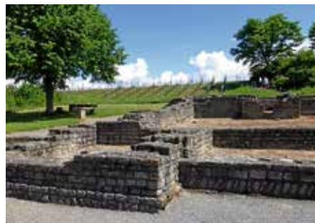
Römischer Gutshof – Foto: Birgit Nollenberger – aus dem Wettbewerb zum Foto des Jahres 2018

Spaziergang „Römischer Gutshof, Krappenfelsen mit Neckar-Ansichten“ am 1. Oktober, 16 Uhr Schon vor rund 1.800 Jahren – zur Zeit der Römer – war Lauffen ein attraktiver Ort zum Leben und Wohnen. Davon zeugt heute die „vila rustica“ (Römischer Gutshof), die 1977 bei Flurbereinigungsmaßnahmen mitten in den Weinreben entdeckt wurde. Und vom nahegelegenen Krappenfelsen aus – hoch über dem Neckar gelegen – wird die Lebensader des Flusses anhand von Neckar-Ansichten im Wandel von Jahrhunderten und aus verschiedenen Blickwinkeln nachvollzogen. Kurzum: Es ist ein kulturhistorischer Spaziergang von der Vergangenheit bis in die heutige Zeit.