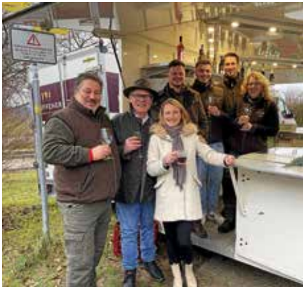
Silvesterausklang mit den Lauffener Jägern

mit der Jahreslosung für 2024 „Alles, was ihr tut, geschehe in Liebe“ im 1. Korinther 16,14 möchte ich Ihnen ein gutes neues Jahr wünschen. Wenn Liebe die Basis unseres Handelns ist, könnten Streit, Hass, und Kriege verhindert werden. Charlie Chaplin, 1881 bis 1977, hat es in seiner „Friedensrede“ so ausgedrückt: „Jeder Mensch sollte anderen helfen, nur so verbessern wir die Welt. Wir sollten am Glück des anderen teilhaben und nicht einander verabscheuen. Hass und Verachtung bringen uns niemals näher. Auf dieser Welt ist Platz genug für jeden, und Mutter Erde ist reich genug, um jeden von uns satt zu machen. Das Leben kann ja so erfreulich und wunderbar sein. Wir müssen es nur wieder zu leben lernen.“ Diese Rede aus dem Film „Der große Diktator“ von 1940 hat nichts von ihrer Aktualität verloren. Auch heute dürfen wir trotz mancher Widrigkeiten und nicht immer befriedigender Zustände in unserem Leben und auf unserem Planeten dankbar sein für all das, was uns im Leben geschenkt wird und was unser Zusammenleben lebenswert macht. Und uns dafür einsetzen, dass es lebenswert und friedlich bleibt.