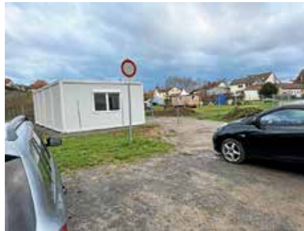
Outdoor Klasse der Kaywaldschule erhält Container auf dem Gelände der Kinderfarm

auf 5,3 Millionen Euro veranschlagt. Der notwendige Kreditbedarf im Haushaltsjahr 2024 wird auf 6,5 Millionen Euro geschätzt. Der voraussichtliche Schuldenstand zum Ende des Planjahres 2024 beträgt im Kernhaushalt 11,92 Millionen Euro. Wir werden in vielen Bereichen den Gürtel enger schnallen müssen.