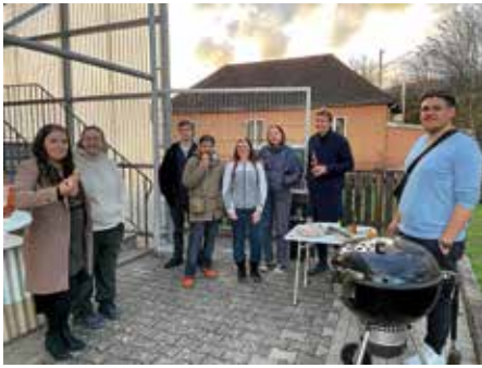
Gefeiert wurde 1 Jahr Jugendwerkstatt in der Kiesstraße

Mit einem kleinen Fest feierten unsere jungen Mitbürger das einjährige Bestehen