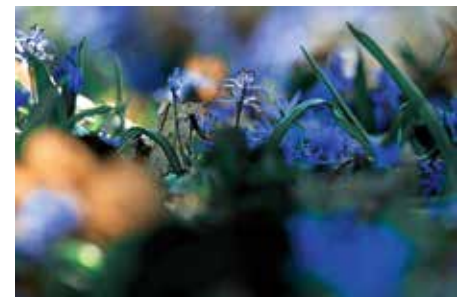
Szilla (Blausterne)-Blüten – aus dem Wettbewerb zum Foto des Jahres 2021

Der Kaywald in Lauffen zeigt sich, wenn die Blausterne blühen, von seiner schönsten Seite. Unterwegs finden sich weitere botanische Besonderheiten. Treffpunkt: Lauffen, Im Brühl am Umspannwerk. Kosten: 9 €/Person, Kinder: 4 € ab 8 Jahre. Anmeldung: Naturparkführerin Ilse Schopper, Telefon 07046/4073176 oder i.r.schopper@gmx.de ■