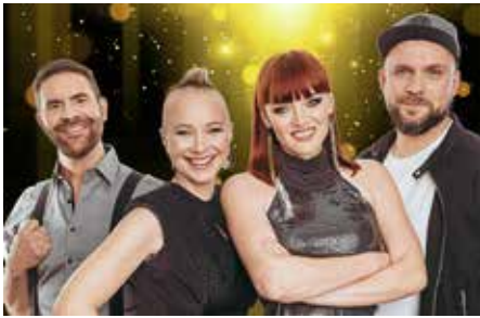
Die A-Cappella-Formation ONAIR verabschiedet sich in diesem Jahr von der Bühne. Mit ihrem Programm „THE VERY BEST!“ ist sie in Lauffen zum letzten Mal zu hören