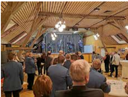
100-jähriges Jubiläum der Stadtkapelle, Musikverein Lauffen a.N. e.V.

Liebe Mitbürgerinnen und Mitbürger, zum 100-jährigen Jubiläum gratulierte ich unserer Stadtkapelle , die im Musikerheim einen fulminanten Geburtstag feierte. Seit einem Jahrhundert bereichert die Stadtkapelle unser Stadtleben mit ihrer Musik, ihrer Leidenschaft und ihrem Engagement. Die Geschichte unserer Stadtkapelle ist eine Geschichte von Gemeinschaft, von Engagement und von kultureller Bereicherung. Durch die Musik haben die Mitglieder der Stadtkapelle nicht nur Töne erzeugt, sondern auch Bindungen geknüpft, Erinnerungen geschaffen und unsere Stadt zu einem lebendigen Ort gemacht. In den vergangenen 100 Jahren hat die Stadtkapelle zahlreiche Höhen und Tiefen erlebt, aber sie ist stets ein fester Bestandteil unseres kulturellen Erbes geblieben. Ihr Engagement, ihre Hingabe und ihr Talent haben Generationen von Bürgern inspiriert und berührt.