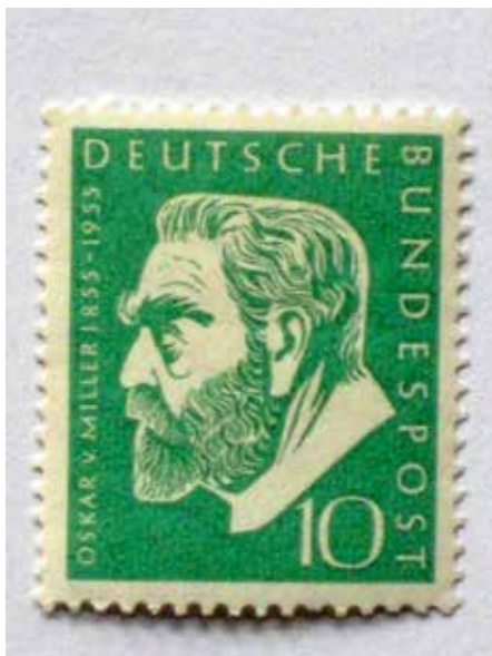
Oskar von Miller