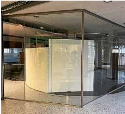
Künftige Bücherei in der Bahnhofstraße 54

Der Gemeinderat fasst zur Vorlage 2024 Nr. 37, auch nach der Vorberatung im Ausschuss, folgenden einstimmigen Beschluss: