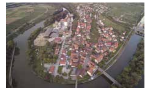
Sanierung Lauffen V Städtle

Sanierung Lauffen „Stadtmitte V“ (Städtle) hier: Bericht der Vorbereitenden Untersuchungen, Sanierungssatzung, Wahl des Sanierungsverfahrens, Förderrichtlinien und Ermächtigung, Beauftragung Sanierungsträger