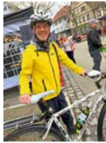
SWR 1 testete die Radwege in und um Lauffen a.N.

Interessierten Menschen (auch ohne Fahrrad), konnten sich selbst ein Bild von einer Radioproduktion aus nächster Nähe machen und mit den Moderatoren und den Mitarbeitern des SWR ins Gespräch kommen.