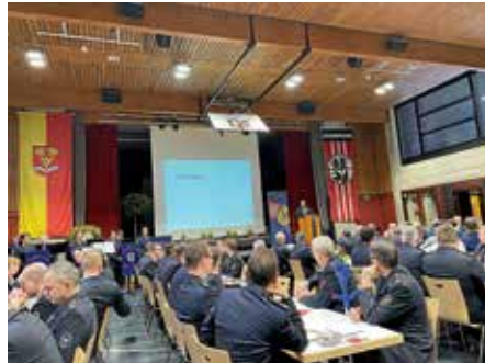
Kreisversammlung der Feuerwehren in Obersulm

Im Städtle gehen die Bauarbeiten fürs Pumpwerk weiter. 56 Spundwände wurden aufwendig herausgezogen. Inzwischen steht das Erdgeschoss der Anlage für unser Pumpwerk Städtle (Baukosten 4 Millionen €).