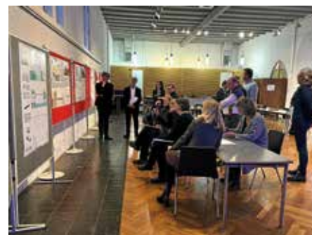
Jurysitzung im Klosterhof zur Rathausbrücke