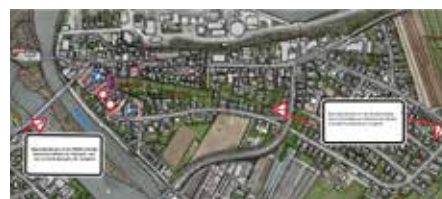
Sperrung Mühltorstraße in Teilbereichen

Der Ausbau des Glasfasernetz in Lauffen geht mit Riesenschritten voran. Ab der KW 14 (von 02.04. bis 16.04.2024) ist es infolge der Tiefbauarbeiten erforderlich die Mühltorstraße zwischen der Heilbronner Straße/Rathausstraße und der Kanalstraße für den Verkehr voll zu sperren.