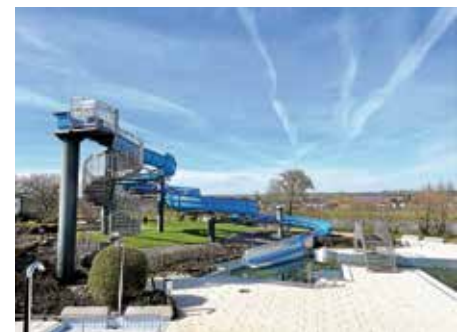
Die neue Rutsche leuchtet schon von weitem und lockt zum Freibadbesuch.

Nigel Nagelneu und noch namenlos! Mach mit beim Namenswettbewerb zur Freibadrutsche. Am 11. Mai geht unser Freibad in Betrieb. Dann soll die neue Rutsche eingeweiht werden und einen Namen erhalten.