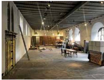
Einbau der Küche/Garderobe im Oktober 2019

Bürgermeisterin Pfründer erklärt, dass kein Beschluss notwendig ist.