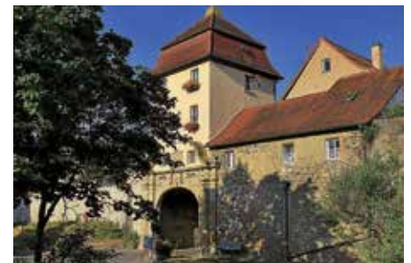
Heilbronner Tor, aus dem Wettbewerb zum Foto des Jahres 2023

Diese Öffentliche Führung mit Gästeführer Karlheinz Torschied hat das Lauffener „Städtle“ zum Ziel. Bei diesem Rundgang durch den am rechten Neckarufer gelegenen historischen Stadtteil werden u. a. geschichtsträchtige Gebäude erschlossen. Die rund zweistündige Führung startet um 15 Uhr im Rathaushof mit der um 1100 von den „Popponen“ errichteten Burg der Grafen von Lauffen.