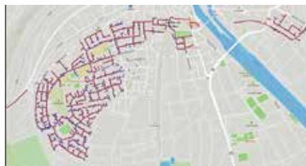
Darstellung zum Fortschritt des Breitbandausbaus