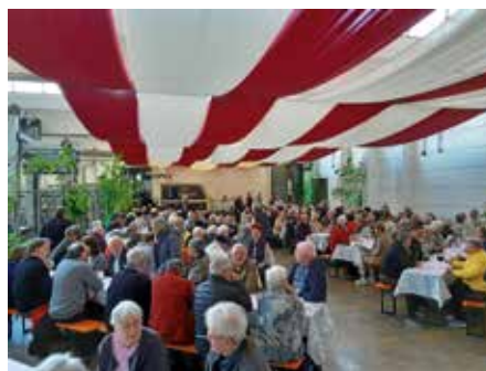
Impressionen vom letzten Jahr

sowie Kaffee und Kuchen freuen. Die Speisen und Getränke werden von der Stadt Lauffen a.N. spendiert.