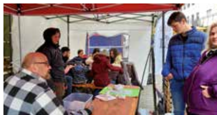
Sprayart und Kinderfarm mit Angeboten für die Kinder und Jugendlichen