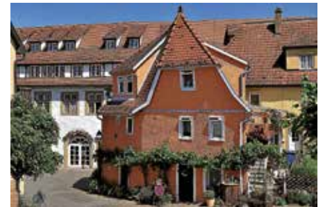
das Städtle – aus dem Wettbewerb zum Foto des Jahres 2023

der die Stadt prägt, und zu den Menschen, die dort ihre Heimat haben. Ob mit Blick von der Rathausinsel (drüben) oder mit Blick von der Regiswindiskirche (hüben) erleben Sie einzigartige Aus- und Einblicke in die wechselvolle Geschichte der Stadt.