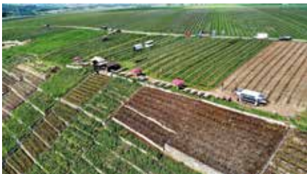
Impressionen aus einer früheren Veranstaltung