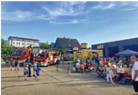
Das 1. Mai-Fest der Feuerwehr war gut besucht

groß war das Interesse an der 2. Planungsworkstatt Städtle , bei dem auch das erarbeitete Solarkataster und der Zeitraum der Brückensanierung vorgestellt wurde. Die Aktion lief im Rahmen des Tags der Städtebauförderung. Rund 50 Zuhörer kamen in den Sitzungssaal des Rathauses. Besonders liegt uns mit der Städtebauförderung am Herzen leerstehende, wenig genutzte oder energetisch unsanierte Gebäude auch im Privatbereich wieder lebendig werden zu lassen. Als Stadt prüfen wir, ob die so genannte Zeag-Scheune, die der Bauhof als Lager nutzt, gerichtet werden kann, sodass das große Dach für Photovoltaik nutzbar ist.