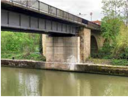
Die schadhafte Stahlbrücke über den Kanal muss mit Hilfsträgern gesichert werden

Im Zuge der Arbeiten an der alten Neckarbrücke (Kanalbrücke) wird für die Baustelleneinrichtungsfläche ab 13.05.2024 eine halbseitige Sperrung der Brücke erforderlich.