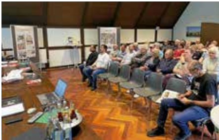
Gut besuchte Planungsworkstatt

groß war das Interesse an der 2. Planungsworkstatt Städtle , bei dem auch das erarbeitete Solarkataster und der Zeitraum der Brückensanierung vorgestellt wurde. Die Aktion lief im Rahmen des Tags der Städtebauförderung. Rund 50 Zuhörer kamen in den Sitzungssaal des Rathauses. Besonders liegt uns mit der Städtebauförderung am Herzen leerstehende, wenig genutzte oder energetisch unsanierte Gebäude auch im Privatbereich wieder lebendig werden zu lassen. Als Stadt prüfen wir, ob die so genannte Zeag-Scheune, die der Bauhof als Lager nutzt, gerichtet werden kann, sodass das große Dach für Photovoltaik nutzbar ist.