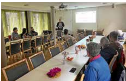
Auftaktveranstaltung Senioren digital

Toll besucht bei herrlichem Sommerwetter war das 1.-Mai-Fest unserer freiwilligen Feuerwehr . Vielen Dank für die Ausrichtung. Die Organisation eines solchen Fests bedarf der Mithilfe vieler Ehrenamtlicher! Ebenso gut angenommen wurde das Weinfest der Privatkellerei Eberbach-Schäfer.