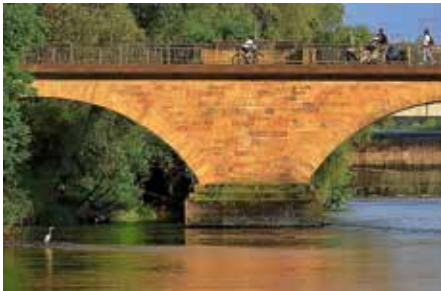
Foto: Frank-M. Zahn aus dem Wettbewerb zum Foto des Jahres 2023: Die alte Neckarbrücke

Themenführung am Pfingstsonntag, 19. Mai um 15 Uhr: „Der Neckar in und um Lauffen“