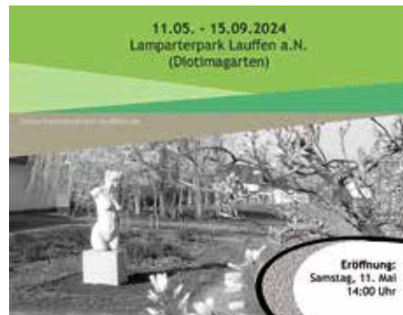
Ausstellungsplakat „Muggafugg, Haschee und Bomboolee – französische Wörter im Schwäbischen; Eine Freiluft-Ausstellung des Heimatvereins Lauffen e.V.“

Aus Anlass der 50-jährigen Städtepartnerschaft Lauffens mit La Ferté-Bernard in Frankreich zeigt das Hölderlinhaus zusammen mit dem Hölderlin-Freundeskreis solche Neuworte von Hölderlin in ihrer französischen Übertragung. Die Ausstellung ist zu sehen vom 5. Mai bis 23. Juni zu den üblichen Öffnungszeiten. Die Ausstellung wird gefördert aus Landesmitteln durch die Arbeitsstelle für literarische Museen, Archive und Gedenkstätten in Baden-Württemberg (Deutsches Literaturarchiv Marbach).