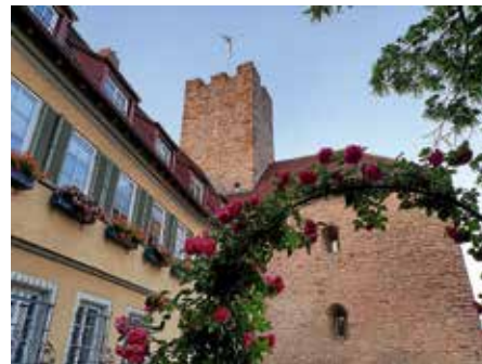
Foto: Hannah Lorenz aus dem Wettbewerb zum Foto des Jahres 2023: Die Rathausburg

Am Pfingstmontag finden zwei öffentliche Kurzführungen mit Gästeführer Gerhard Kuppler durch die Lauffener Grafenburg statt. Die Grafen – auch Popponen genannt – waren bis zu ihrem Aussterben männlicherseits um 1219 als Amtsträger des Reichs ein einflussreiches Adelsgeschlecht im Neckartal von Lauffen bis hin nach Heidelberg. Start ist um 15 Uhr und 15.45 Uhr.