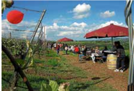
Impressionen aus einer früheren Veranstaltung

Entweder Sie scannen untenstehenden QR-Code und lassen sich von Google-Maps den Weg in die Weinberge zeigen. Oder Sie folgen den beiden ausgeschilderten Wegen zum Festgelände. Einfach dem Fahrradweg am Bergsaum in Richtung Meimsheim folgen, bis Sie über eine ausgeschilderte Wengertstaffel zum Festgelände geführt werden. Oder Sie wählen den Weg mit Aussicht und folgen ab dem Wohngebiet