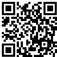
QR-Code Bergfest 2024

Entweder Sie scannen untenstehenden QR-Code und lassen sich von Google-Maps den Weg in die Weinberge zeigen. Oder Sie folgen den beiden ausgeschilderten Wegen zum Festgelände. Einfach dem Fahrradweg am Bergsaum in Richtung Meimsheim folgen, bis Sie über eine ausgeschilderte Wengertstaffel zum Festgelände geführt werden. Oder Sie wählen den Weg mit Aussicht und folgen ab dem Wohngebiet