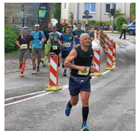
Der Trollinger Marathon führte die Marathon-LäuferInnen auch durch Lauffen a.N.