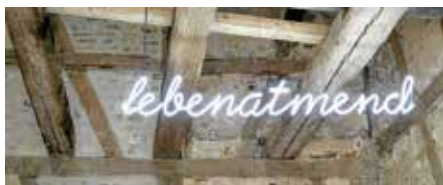
Hölderlins Neuwortschöpfungen begegnet man im Hölderlinhaus an vielen Stellen: wie hier in der Dauerausstellung, noch intensiver aber in der Sonderausstellung ab 5. Mai

Gleich zwei speziell für diesen Anlass gestaltete Ausstellungen – einmal vom Hölderlin-Freundeskreis im Hölderlinhaus (ab 5. Mai), einmal eine Freiluftausstellung des Heimatvereins im Lamparter-Park – sowie ein großes Festkonzert sind an diesem Wochenende zu erleben. Komplettiert werden diese internationalen Angebote zudem durch einen französischen Markt auf dem Postplatz (9. – 11. Mai) und einen deutsch-französischen Gottesdienst in der Regiswindiskirche mit Pfarrer i.R. Gerhard Kuppler (12. Mai, 10 Uhr) und anschließendem Kirchencafé.