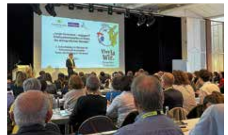
Deutsch-französischer Kongress des Staatsministeriums

freut feststellen, dass durch vielfältige, gegenseitige Kontakte unsere Städtefreundschaft lebt. Die engen Verbindungen verknüpfen die Rathäuser, die Partnerschaftsausschüsse, die Vereine und Kirchen, vor allem auch viele einzelne Familien. Aus Fremden wurden Partner und dann gute Freunde. Über die deutsch-französische Grenze hinweg wurde eine feste Brücke gebaut. Alle Mitbürgerinnen und Mitbürger unserer beiden Städte laden ich deshalb herzlich ein, an unserer – in den Partnerschaftsurkunden festgehaltenen – großen Aufgabe mitzuwirken. Wenn Sie Interesse haben, freuen wir uns auf Ihre Rückmeldung an die Stadt oder auch das Partnerschaftskomitee. Möge sich die überaus positiv Entwicklung unserer deutsch-französischen Freundschaft in den kommenden Jahren fortsetzen. Allen, die unsere Städtefreundschaft in den letzten 50 Jahren getragen und gefestigt haben, gilt mein aufrichtiger und herzlicher Dank!