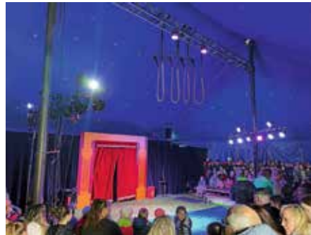
Gelungenes Zirkusprojekt der Herzog-Ulrich Grundschule

Vormittag von Eckard Selk und Wolfgang Arndt vom Netzwerk für Senioren-Internet-Initiativen Baden-Württemberg e.V.